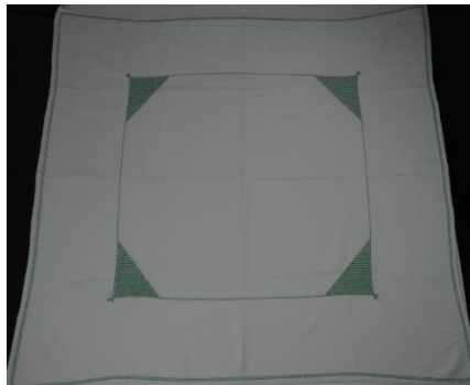
Sach wedi ei hailgylchu i greu lliain bwrdd

Yn yr un modd â heddiw, roedd cyplau yn dibynnu yn helaeth ar gymorth teulu, ffrindiau a chymdogion i gynnal priodasau, ac roedd y gymuned leol yn chwarae rhan bwysig yn y trefnu a'r dathlu. Yn aml, roedd ffrindiau a theulu hefyd yn 'rhoi' cwponau i gwpl cyn eu priodas fel anrheg.