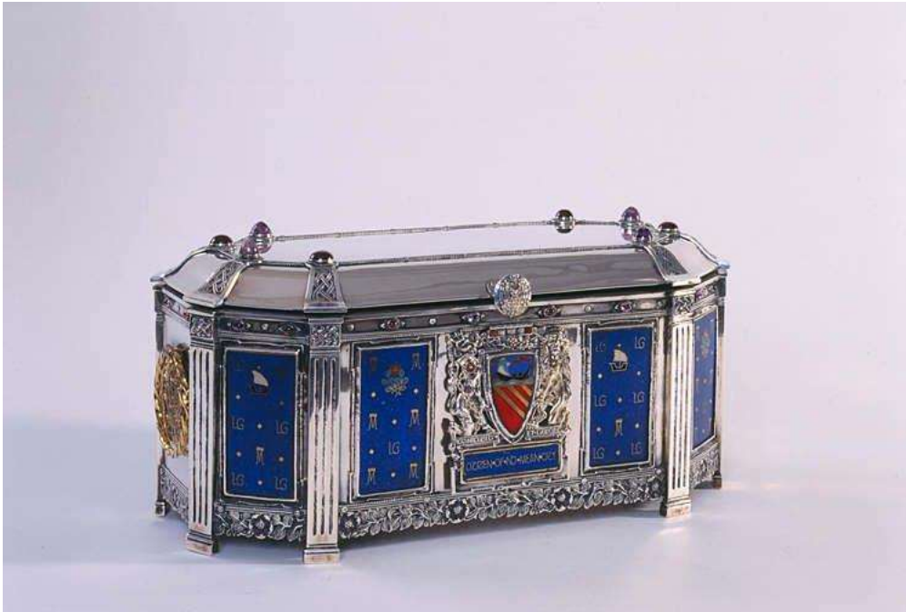
Casged Maenceinion – 1918