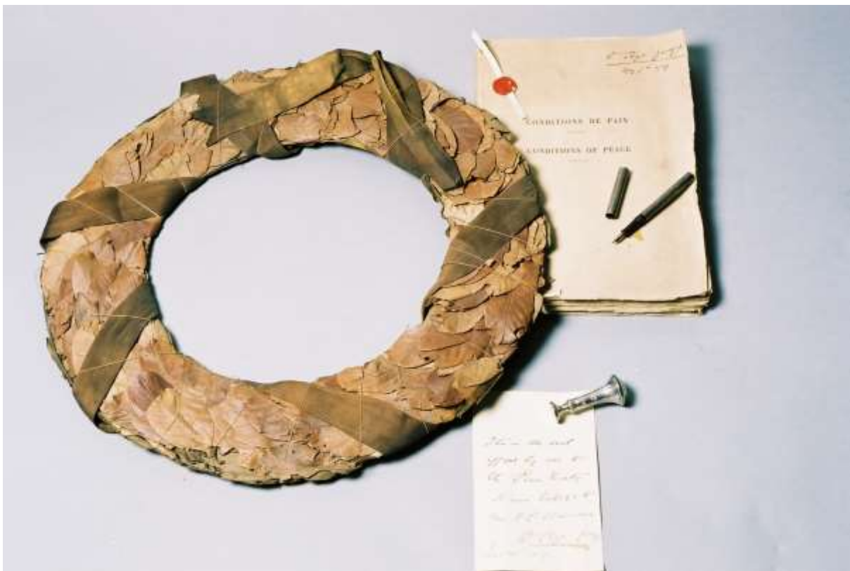
Copi drafft o'r cytundeb heddwch efo sêl arian a torch llawryf – Roedd y sêl yn anrheg gan ei wraig Frances