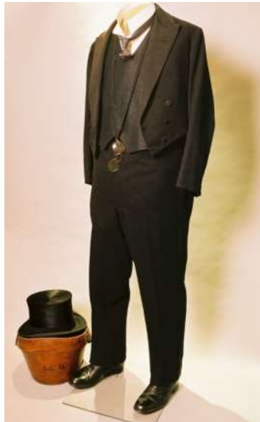
Gwisg Gweinidogol Lloyd George