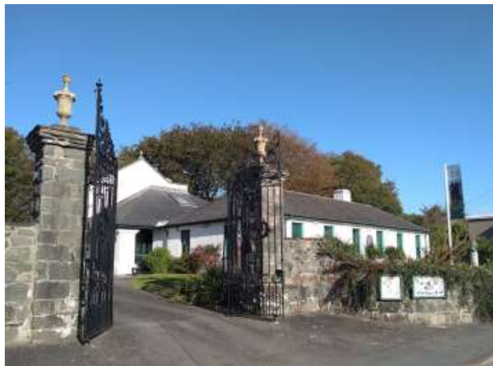
Amgueddfa Lloyd George – Llanystumdwy