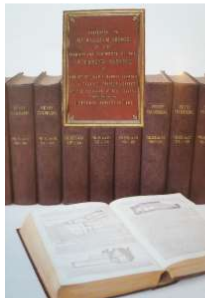
Llyfrau William George

Er ei fod yn rhywfaint o rebel, rhagorodd David yn ei astudiaethau yn ysgol y pentref a dysgodd Lladin a Ffrangeg hefyd er mwyn bod yn gymwys i hyfforddi fel cyfreithiwr. Ym 1884, pasiodd ei arholiadau olaf yn y gyfraith gydag anrhydedd, a sefydlodd bractis cyfreithiol yng Nghricieth. Ym 1890 fe'i etholwyd yn AS i'r Rhyddfrydwyr dros Gaernarfon, ac yntau yn ddim ond 27 oed. Ym 1906 daeth yn Llywydd y Bwrdd Masnach, a chydabuwyd ef fel gwleidydd medrus. Yn ddiweddarach, cafodd ei ddyrchafu yn Ganghellor a bu'n gyfrifol am gyflwyno'r pensiwn gwladol, ac am ddatgan rhyfel ar dlodi yng 'nghyllideb y bobl' ym 1909. Er mwyn talu am ddiwygiadau cymdeithasol eang, ynghyd ag ehangu'r Llynges, bwriad Lloyd George oedd cyflwyno trethi ar diroedd, a gododd wrychyn tiffeddianwyr ac aristocratiaid. Yn y pen draw, pasiwyd y gyllideb yn cynnwys y mesurau diwygio yn sgil Deddf y Senedd 1911 a waniodd rym Tŷ'r Arglwyddi i rwystro deddfwriaeth o Dŷ'r Cyffredin.