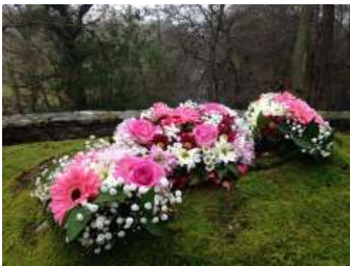
Bedd Lloyd George - Llanystumdwy

Ym 1944, dychwelodd i Lanystumdwy a chafodd ei greu yn Iarll Lloyd-George o Ddwyfor yn yr un flwyddyn. Bu farw yn y flwyddyn ddilynol, yn 82 mlwydd oed. Fe ddewisodd gael ei gladdu yng Nghymru ar lannau'r Afon Dwyfor oedd mor agos at ei galon, a chomisynwyd y pensaer adnabyddus Clough Williams-Ellis i ddylunio'r ardal o amgylch y bedd.