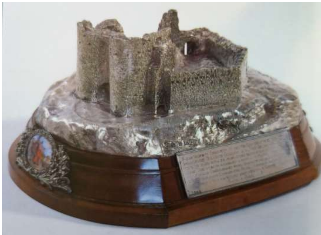
Replica arian o gastell Cricieth – cyflwynwyd i Lloyd George- 1919