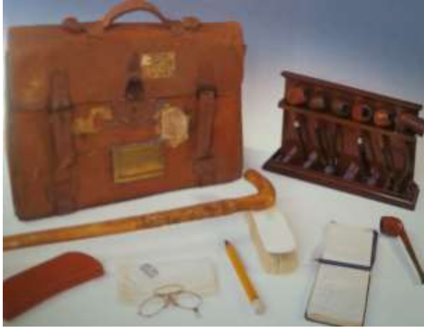
Eiddo personol Lloyd George yn yr amgueddfa

calonnau.” Canmolwyd Lloyd George yn eang fel y dyn a enillodd y Rhyfel Byd Cyntaf, ac ym 1918 enillodd y clymblaid fwyafrif enfawr. Dyma hefyd oedd yr etholiad cyntaf lle caniatwyd i ferched bleidleisio.