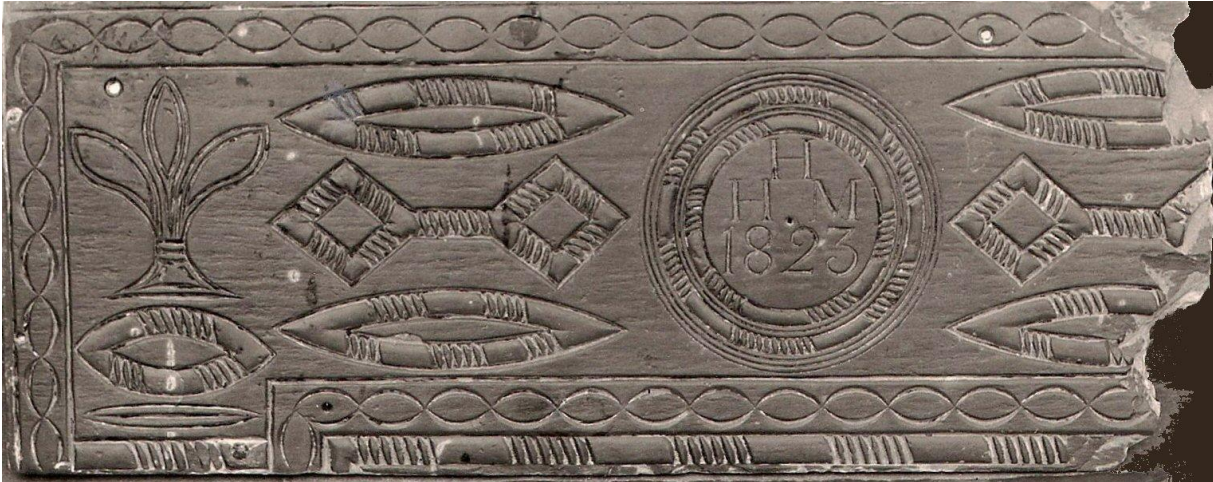
Llechen uwchben tân – Dyffryn Ogwen 1823

Mae rhai o'r enghreifftiau gorau o'r gelf werin hon yn dyddio o tua 1823 i 1845. Darganfuwyd y mwyafrif yn ardal Dyffryn Ogwen, er bod ychydig o enghreifftiau wedi'u darganfod yng Nghorris a Ffestiniog. Datgelodd ymchwiliadau archeolegol diweddar o ranbarth Dyffryn Nantlle weithiau tebyg.